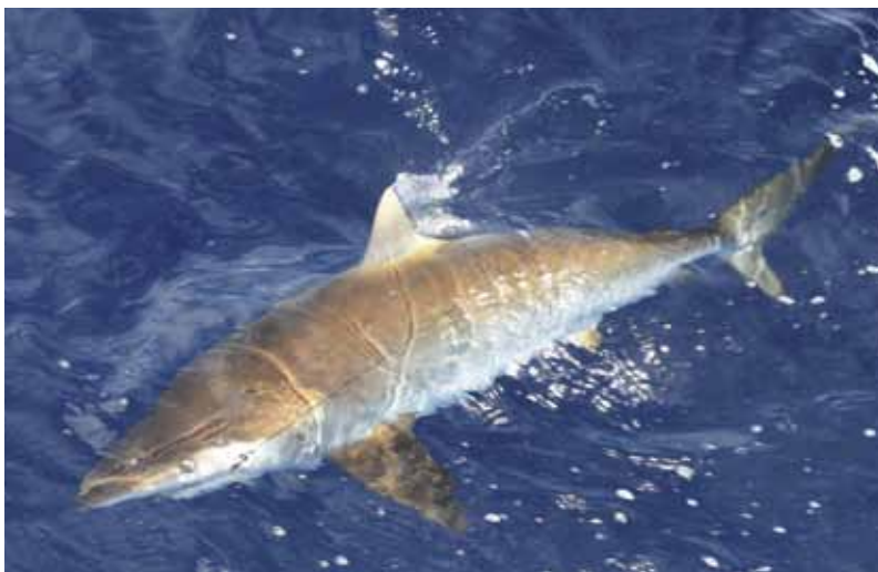
Zo'n stierhaai heb je liever niet in de boot...

aasvis. Snel werpt Cody zijn net uit en vangt wat kleine aasvis. Daarna beginnen we op het rif. Hier vangen we tijdens het varen al wat mooie tonijn van verschillende soorten. Ook hier staan we al snel weer een vis te drillen die niet eens zo groot is, maar ons alle hoeken laat zien. De kleine tonijntjes vechten als grote exemplaren.