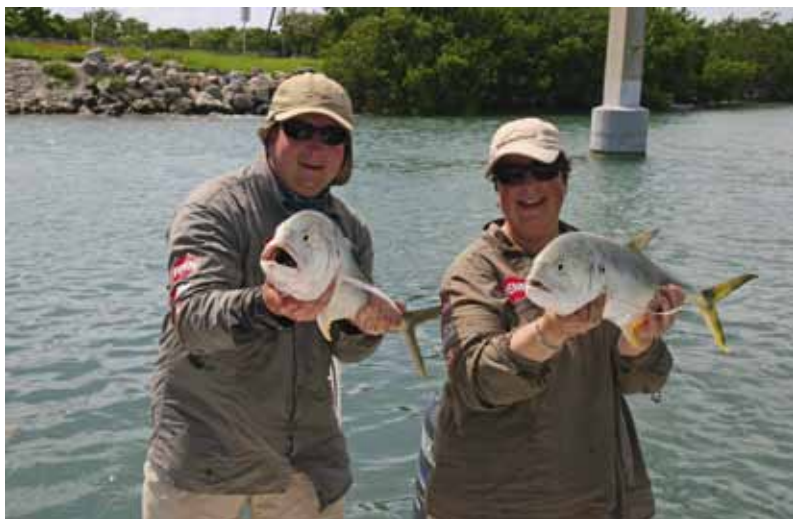
Jacks are fun!

De keuze aan charterboten is enorm. Van de echte Big Game jachten (foto) tot party boats en snelle centerconsole visbootjes voor de flats.