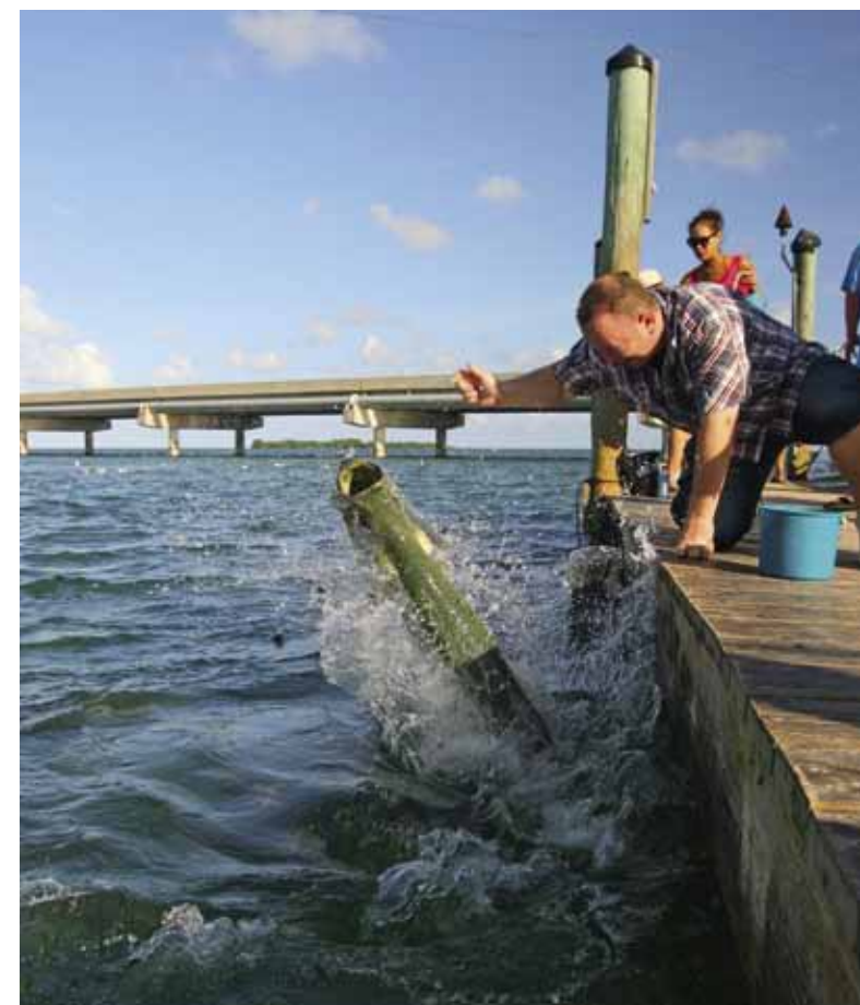
Niet alleen een paradijs voor sportvissers!