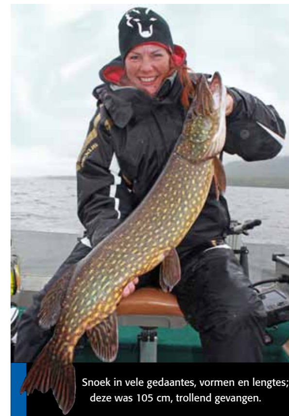
Snoek in vele gedaantes, vormen en lengtes; deze was 105 cm, trollend gevangen.