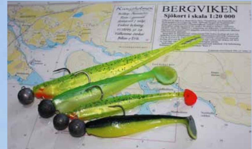
Chartreuse en groen waren top. De beste shads van de reis: Fork Tail 18 cm, Salt Shaker 5 inch, Tiddler Fast en Zander Pro.

raken. Maar ken je er eenmaal de weg, dan ligt er een enorm potentieel aan weinig bevestig water voor je open, waar de woorden 'overbevissing' of 'dressuur' onbekend zijn. Daarover zo meer.