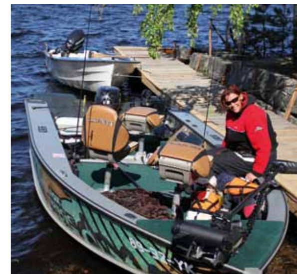
Vanuit het kleine haventje aan het huis is het niet ver naar de stekken.

Terug naar het open water: wie met kunstaas slepend wat grote snoek wil vangen, moet het zoeken in de buurt