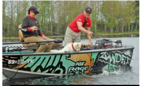
Zelfs de hond had een leuke vakantie!

tel. 0031 - (0)493310103 tel. 0031 - (0)6-83948265