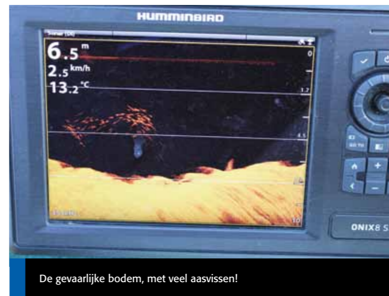
De gevaarlijke bodem, met veel aasvissen!