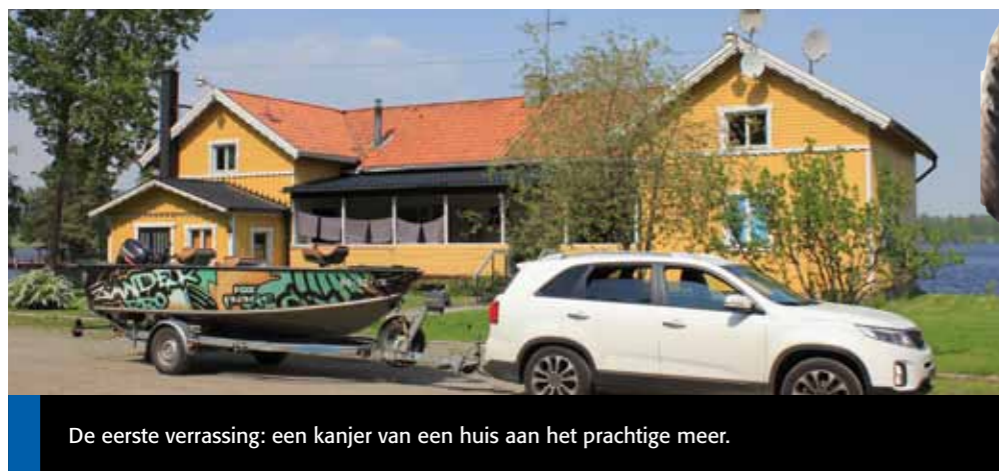
De eerste verrassing: een kanjer van een huis aan het prachtige meer.